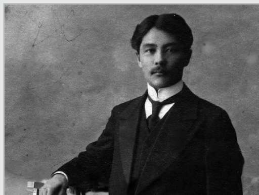
Майнагашев Степан Дмитриевич (8 января 1886 – 29 апреля 1920) – этнограф-востоковед, основатель хакасской письменности и автономии

KEYWORDS: Mainagashevs, seok, tomnar, DNA genealogy, Khakass, Y-chromosome, haplogroup, Oreshkovs, subclade N-P43-VL67.